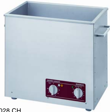
RK 1028 CH