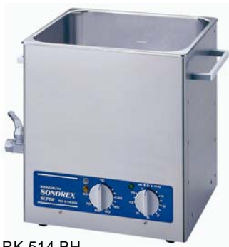
RK 514 BH