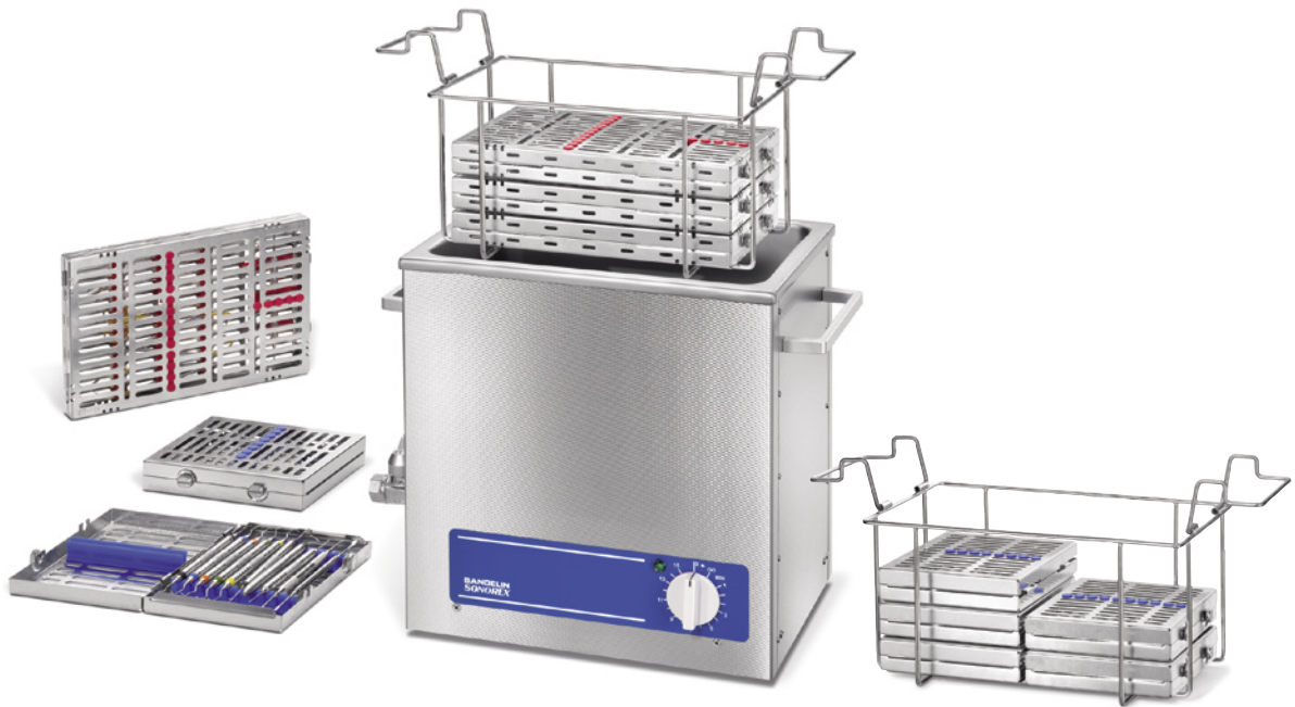
SONOREX SUPER RK 513 mit Kassettenhalter KAH 13 und bestückten Kassetten