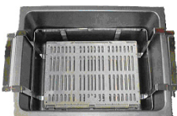
KAH 13 Instrumenten-Desinfektion und -Reinigung in Kassetten