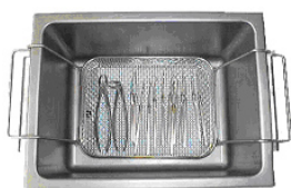
K 13 Instrumenten-Desinfektion und -Reinigung