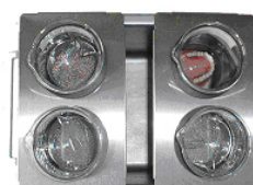
2 x DE 3 BL Bohrerreinigung und Zemententfernung gleichzeitig