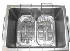
K 3 CL Desinfektion und Reinigung zweier Instrumentensätze lose gepackt