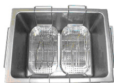
K 3 CL Desinfektion und Reinigung zweier Instrumentensätze lose gepackt